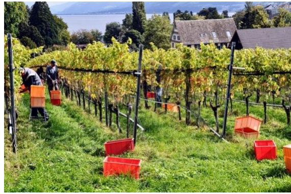
Weinlese auf der Halbinsel Au