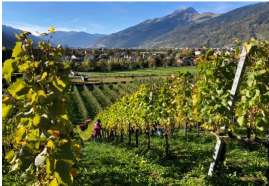
Weinlese in Malans

Aufgrund der noch nicht vollständig eingegangenen Erntezahlen einzelner Kantone werden wir die Ernteergebnisse 2021 der Deutschschweiz in der nächsten Ausgabe vom 7. Dezember 2021 zusammenfassen.