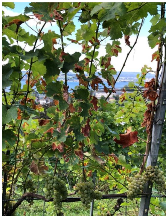
Symptome der Esca-Krankheit. Typisch sind die nekrotischen Blattaufhellungen, auch Tigerstreifen genannt.